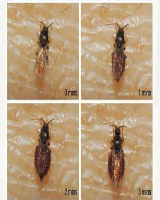
小黑蚊吸血連續照片