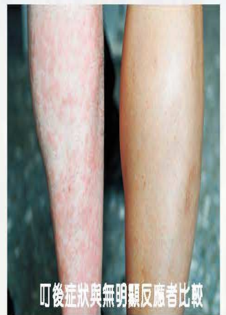
叮後症狀與無明顯反應者比較

雌成蟲通常叮人體的 小腿、膝蓋、手背、手肘 等部位，叮後易產生 奇癢、紅腫或過敏 等症狀。但有些人被叮後無明顯反應。